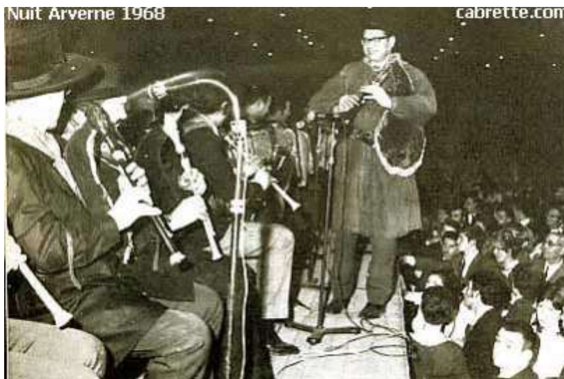
Nuit Arverne 1968