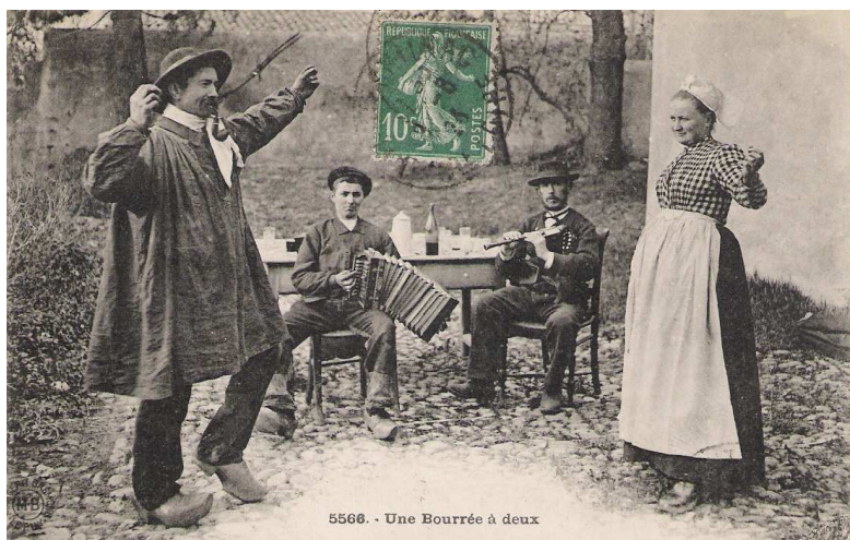
5568. - Une Bourrée à deux

La bourrée est à la fois une danse et un chant, car il n'existe pas de bourrée qui n'ait qu'un couplet. Quelquefois plusieurs versions différentes. Ces paroles sont le plus souvent satiriques, quelquefois tendres ou mélancoliques et parfois très gauloises. Elles sont chantées par le Cabretteux qui joue en même temps l'air sur la Cabrette ; en patois "lo cobreto". Ces quelques phrases chantées, allusions à un événement local, esquisses d'idylle ou de satire, pleines de sel, de bon sens et de poésie, en patois, perdent leur signification lorsqu'on essaie d'adapter une traduction française à leur rythme, car le patois auvergnat, très riche, mais très concis, permet bien rarement une adaptation exacte.